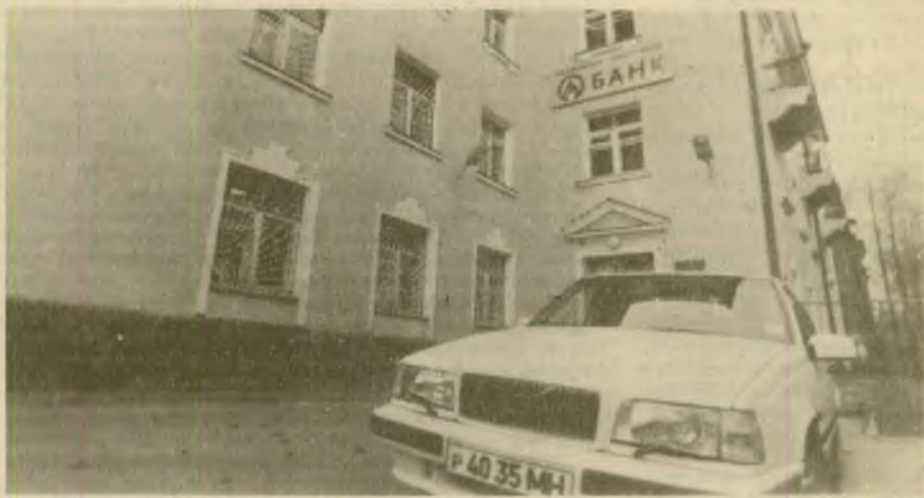
Хорошо известное в городе учреждение - Мытищинский коммерческий банк.